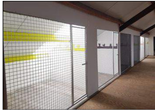
Hoe het is geworden...