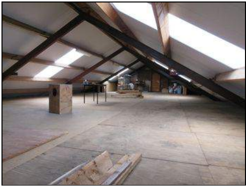
Hoe het was...