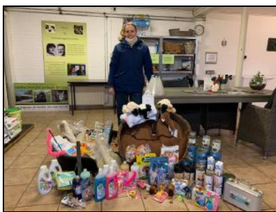
Donatie Trimsalon Plucky