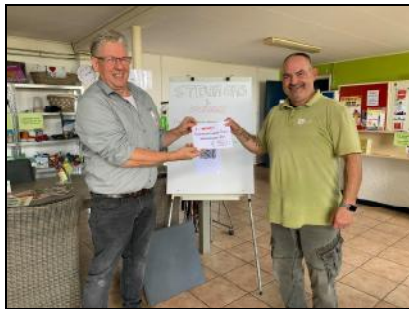
Spar van Wijnen Oud Vossemeer