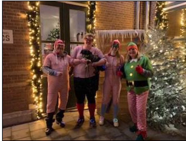
Bij Christmasstation Arkel overhandigen check

Het begin is gemaakt van de aanpassingen speelweide..... In het jaarverslag van 2022 zult u de vorderingen zien.